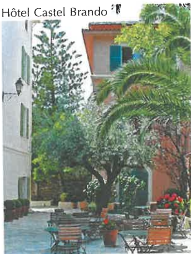
Hôtel Castel Brando