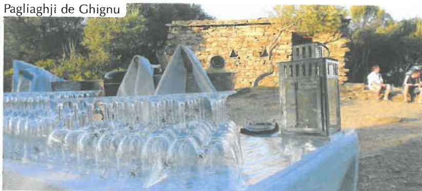
Pagliaghji de Ghignu