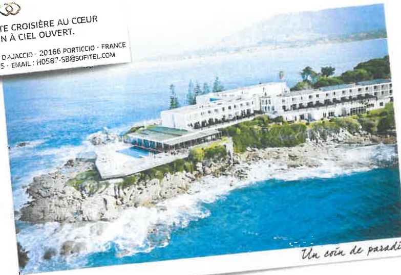
Un coin de paradis

DOMAINE DE LA POINTE GOLFE D'AJACCIO - 20166 PORTICCIO - FRANCE TEL. : +33 (0)4 95 29 40 45 - EMAIL : H0587-SB@SOFITEL.COM