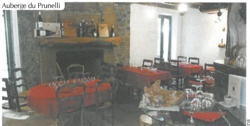
Auberge du Prunelli