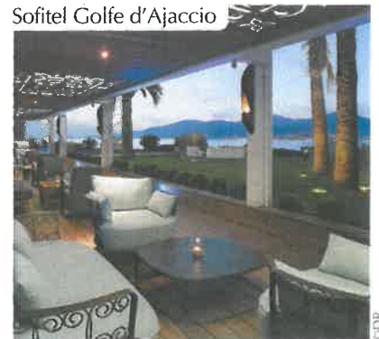
Sofitel Golfe d'Ajaccio

www.radissonblu.com/fr/resort-ajacciobay