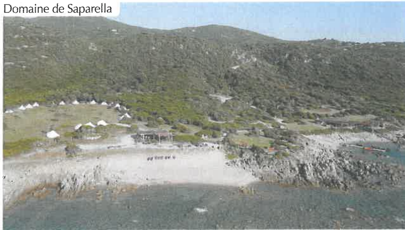
Domaine de Saparella