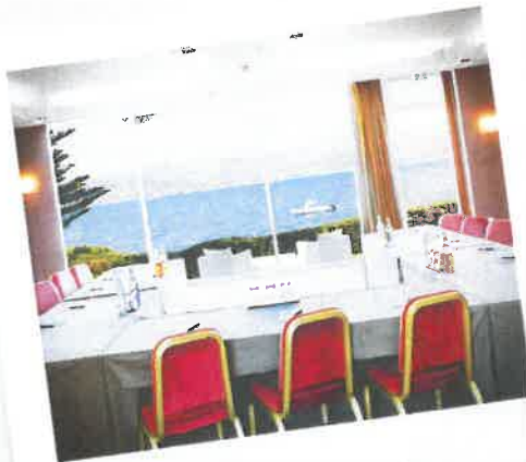
Réunion vue mer