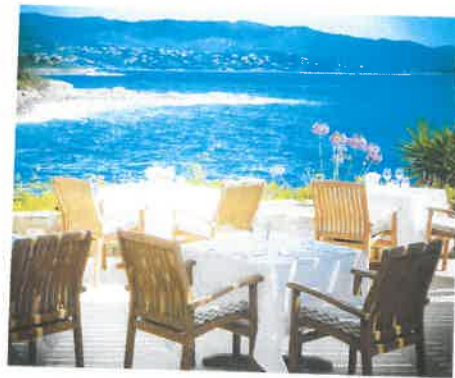
La terrasse du restaurant